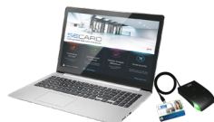
SECARD Kit de programación SECARD y protocolos OSDPT™ v1 y v2